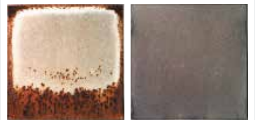
Galvanised steel Z275 (Heavy sign of Rust)

Atmospheric exposure tests and 30 years of manufacturing confirm ZINCALUME® steel has corrosion resistance far superior to that of ordinary zinc coatings. ZINCALUME® steel may last up to 4 times longer than traditional galvanized material in an identical environment.